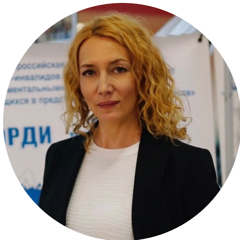
Председатель РО ВОРДИ Тюменской области

Основная задача регионального отделения ВОРДИ на территории Тюменской области: системные, комплексные решения в интересах детей-инвалидов и взрослых с инвалидностью, которые не могут самостоятельно представлять свои интересы, их родителей и опекунов.